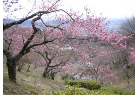
筑波山の梅 平成23年2月撮影

私たちも元気に精一杯頑張りますので、ご支援・ご協力を賜りますようよろしくお願い申し上げます。