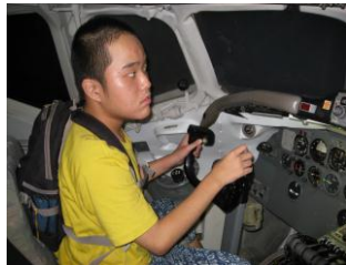
操縦体験中。 真剣なまさがし。