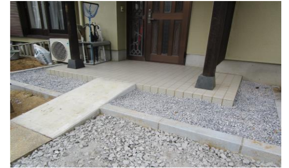
ぱれっと玄関を整備しました