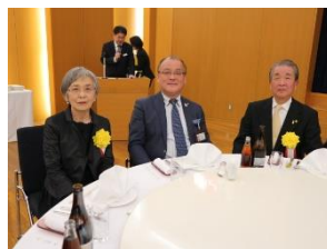
一般功労表彰祝賀会の様子

ユーアンドアイの根底にある困ったときはお互い様さまに活きた活動だったと当時を振り返り改めて感じました。